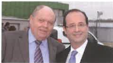
Avec François Hollande à Reims

Le Président de la République a besoin d'une majorité de gauche, dont je fais partie, pour mettre en application ses 60 propositions et redresser la France. Les temps difficiles que notre pays connaît, exigent des députés solides qui ont fait leurs preuves.