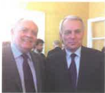
Avec le Premier ministre J-M Ayrault

Mon action politique s'est toujours inspirée des valeurs de la gauche : la laïcité, c'est-à-dire le respect de la liberté de conscience, l'égalité de tous les citoyens, la fraternité qui implique la réduction des inégalités sociales. Connaissant personnellement la plupart des nouveaux ministres, il me sera aisé de les sensibiliser à la situation difficile de notre circonscription.