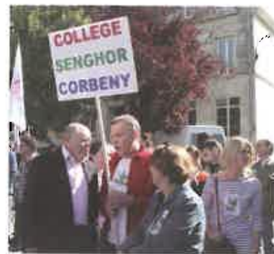
Pour la défense de nos écoles

Durant ce mandat, j'ai toujours été proche de vos préoccupations quotidiennes en répondant à près de 30.000 sollicitations et en solutionnant une bonne part des problèmes posés. Vous m'avez rencontré lors des rassemblements organisés pour la défense de l'emploi, des retraites et contre les suppressions de classes. Je continuerai à rester à votre écoute et à être votre porte-parole.