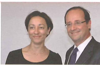
François Hollande Président de la République