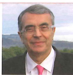
Jean-Jack Queyranne Président du Conseil régional Rhône-Alpes