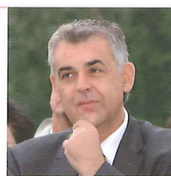
Pascal Terrasse Président du Conseil général de l'Ardèche