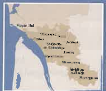
HAUTE-SAINTONGE ET SAINTONGE ATLANTIQUE

Conseiller Général du Canton de Montguyon Maire de Saint-Pierre du Palais