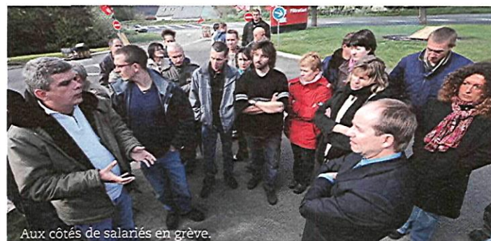
Aux côtés de salariés en grève.