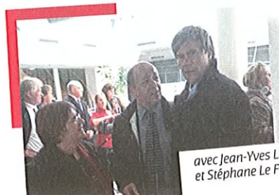
avec Jean-Yves Le Drian et Stéphane Le Foll