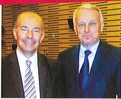
À l'Assemblée Nationale, le 9 mai 2012.

Le Président de la République m'a témoigné de sa confiance en me nommant Premier Ministre. Pour réussir à mettre en œuvre ses 60 engagements, j'ai besoin d'une majorité large, solide et loyale à l'Assemblée Nationale. Pour une politique nouvelle, pour réussir le changement, je vous appelle à un vote de cohérence.