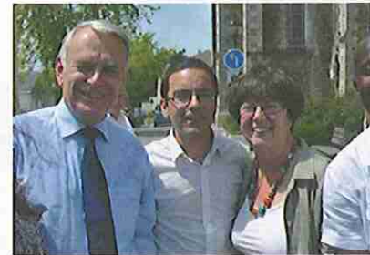
Avec Jean-Marc AYRAULT