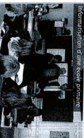
Information d'une école primaire