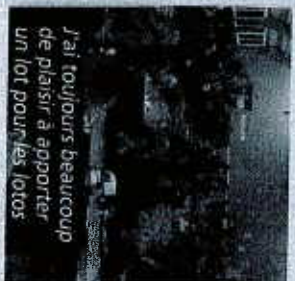
J'ai toujours beaucoup de plaisir à apporter un lot pour les lotos