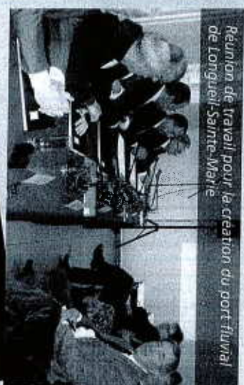
Réunion de travail pour la création du port fluvial de Longueil-Sainte-Marie