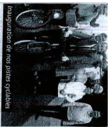
Inauguration de nos pistes cyclables