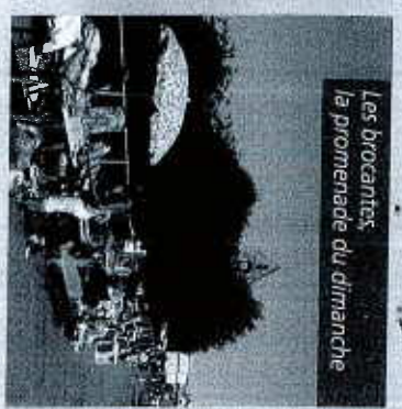
Les brocantes, la promenade du dimanche