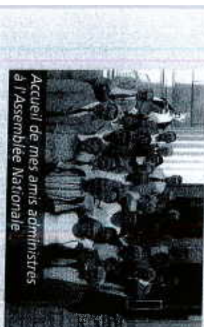
Accueil de mes amis administrateurs à l'Assemblée Nationale