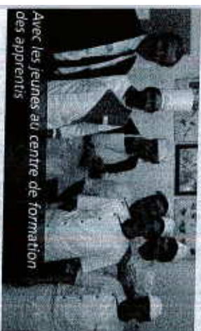
Avec les jeunes au centre de formation des apprentis