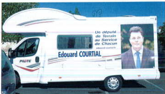
Je vais à votre rencontre aux quatre coins de la circonscription à bord de mon camping-car