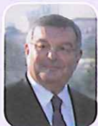
Michel MERCIER Président du Conseil Général du Rhône

+ D'IMMIGRATION + D'INSÉCURITÉ + D'IMPÔTS