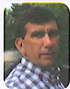
Pierre Marmonier Maire de Colombier Saugnieu