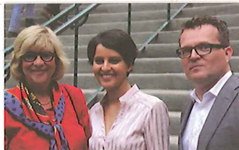
Najat Vallaud-Belkacem, Ministre aux Droits des femmes avec Pascale Crozon et Loïc Chabrier, suppléant

Pour la cause des femmes, pour les jeunes et l'égalité entre tous