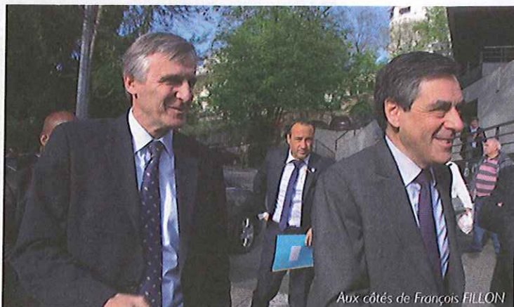
Aux côtés de François FILLON

Il faut défendre l'euro, et la construction d'une Europe qui protège ses citoyens dans la mondialisation.