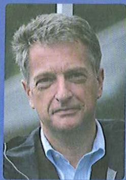
Hervé Gaymard a 52 ans. Député, il est également Président du Conseil Général de la Savoie .