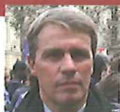
Patrick Bloche Maire du 11ème arrondissement de Paris