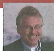
Daniel Cohn-Bendit Député européen