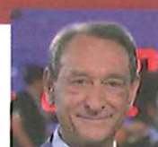
Bertrand Delanoë Maire de Paris