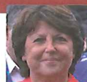
Martine Aubry Première secrétaire du PS