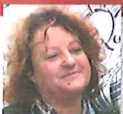
Frédérique Calandra Maire du 20ème arrondissement de Paris