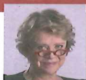
Eva Joly Députée européenne