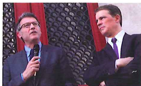
Avec Vincent Peillon rue de la Fontaine au Roi (11 e ) le vendredi 25 mai