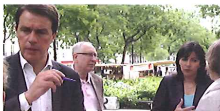
Avec Anne Hidalgo sur le marché Oberkampf (11 e ) le vendredi 1 er juin

Je connais depuis longtemps Patrick Bloche. Nous avons travaillé ensemble sur l'égalité d'accès à l'éducation et à la culture. Pour mettre en œuvre le changement tout particulièrement à l'école, il faut que Patrick Bloche vous représente à l'Assemblée nationale. La force de ses convictions, sa connaissance des dossiers, son engagement volontaire sur de nombreux sujets seront précieux.