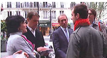
Avec Bertrand Delanoë et Dominique Bertinotti rue Saint Antoine (4 e ) le lundi 4 juin

Pour les valeurs de Paris, pour le nouvel élan de la France, pour plus de justice, de solidarité, pour le dynamisme d'une société qui retrouve confiance en elle-même, je vous invite à voter pour Patrick Bloche, un homme de terrain, de conviction, de générosité, qui vous représentera avec exigence et avec talent à l'Assemblée nationale.