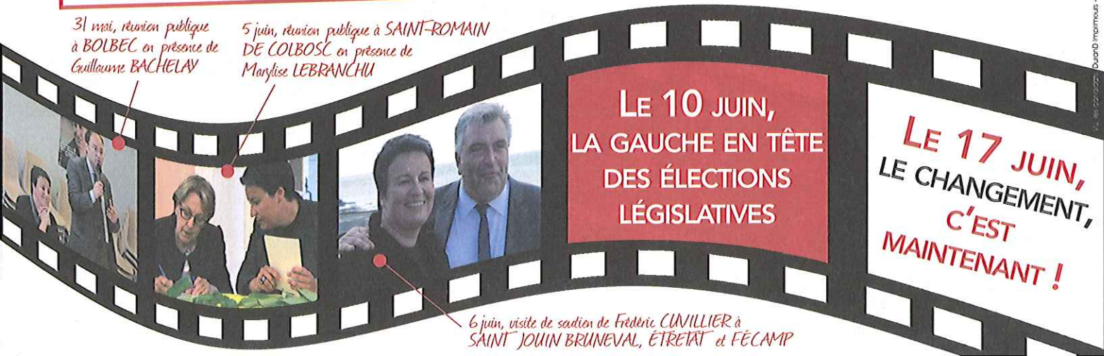
5 juin, réunion publique à SAINT-ROMAIN DE COLBOSC en présence de Marylise LEBRANCHU

LE 10 JUIN, LA GAUCHE EN TÊTE DES ÉLECTIONS LÉGISLATIVES