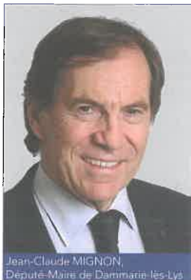
Jean-Claude MIGNON, Député-Maire de Dammarie-lès-Lys