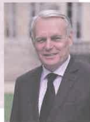
Jean-Marc Ayrault - Premier ministre

Son énergie sera un atout pour votre circonscription et le gouvernement de notre pays. »