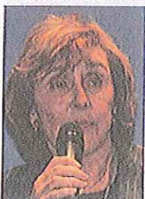
Edith CRESSON Ancien Premier Ministre