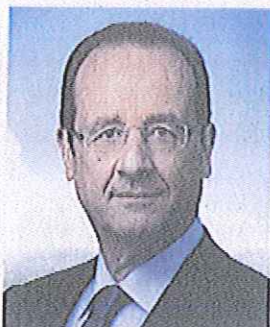
Avec le soutien de François Hollande