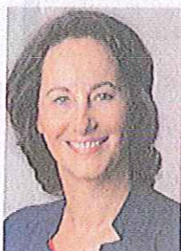
Ségolène ROYAL Présidente de la Région Poitou-Charentes

La mobilisation de toutes et tous est nécessaire pour donner une majorité au changement. »