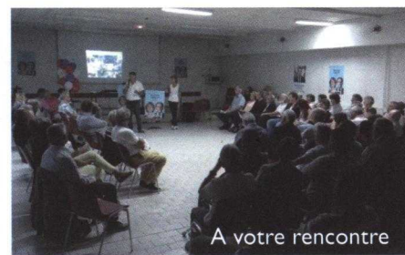
A votre rencontre