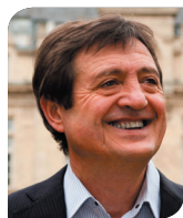
Gilles POUX Maire de La Courneuve

Marie-George Buffet est LA députée féministe qui défend les droits des femmes. La réélire, c'est se donner l'assurance que nos voix de femmes seront entendues et défendues.