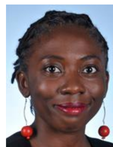
Mme Danièle Obono Lois La France insoumise