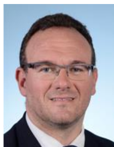
M. Damien Abad Affaires sociales Les Républicains