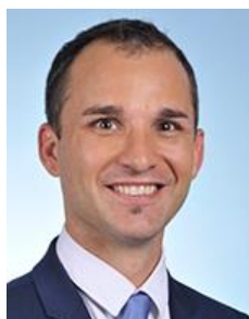
M. Christophe Naegelen Affaires étrangères UDI et Indépendants