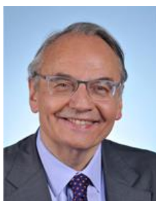
M. Jean-Louis Bourlanges Finances Mouvement Démocrate et apparentés