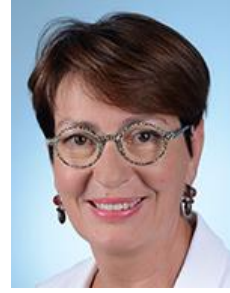
Mme Marietta Karamanli Lois Socialistes et apparentés