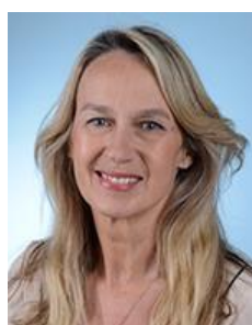
Mme Constance Le Grip Affaires culturelles et éducation Les Républicains