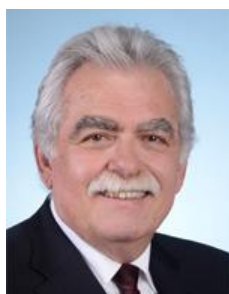
M. André Chassaigne Défense Gauche démocrate et républicaine