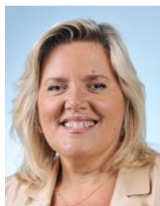
Mme Michèle Tabarot Affaires étrangères Les Républicains