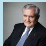
Jean-Pierre Raffarin Ancien Premier ministre Président de la fondation Leaders pour la Paix