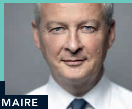
Bruno LE MAIRE