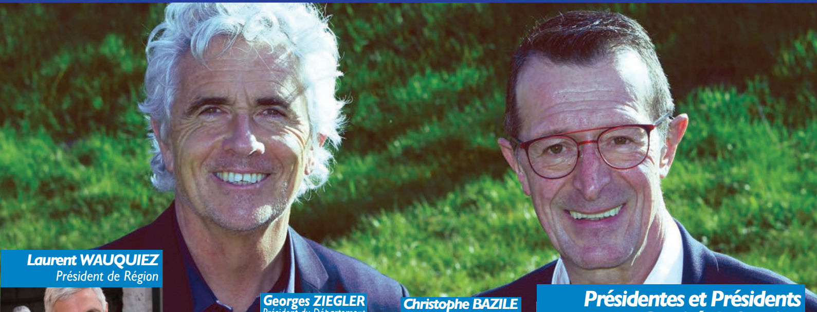
Laurent WAUQUIEZ Président de Région