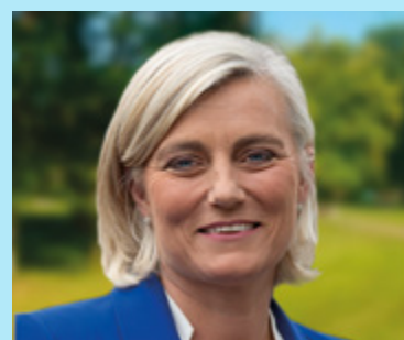
Stéphanie Rist 48 ans

Je suis mère de 3 enfants. Diplômée de la faculté de médecine de Paris, je suis médecin rhumatologue à l'hôpital d'Orléans et députée de la 1ère circonscription du Loiret depuis 5 ans. Membre de la Commission des Affaires Sociales, j'ai contribué à la construction de la loi Ma Santé 2022, aux budgets de la Sécurité Sociale et j'ai porté une loi visant à améliorer le système de santé par la confiance et la simplification.