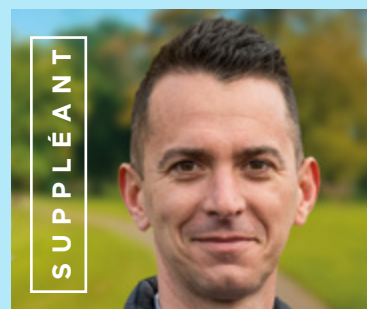
Romuald Genty 39 ans

Je suis mère de 3 enfants. Diplômée de la faculté de médecine de Paris, je suis médecin rhumatologue à l'hôpital d'Orléans et députée de la 1ère circonscription du Loiret depuis 5 ans. Membre de la Commission des Affaires Sociales, j'ai contribué à la construction de la loi Ma Santé 2022, aux budgets de la Sécurité Sociale et j'ai porté une loi visant à améliorer le système de santé par la confiance et la simplification.