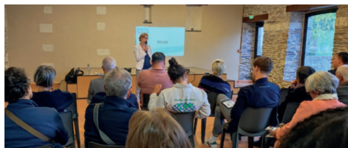
Rencontre avec les acteurs économiques