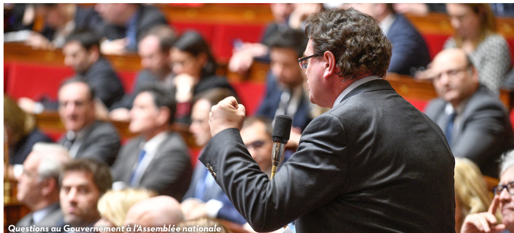
Questions au Gouvernement à l'Assemblée nationale