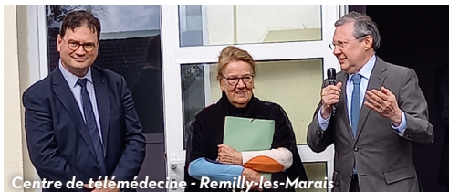
Centre de télé-médecine - Remilly-les-Marais