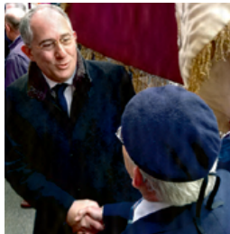
Cérémonie patriotique, toujours soucieux du devoir de mémoire