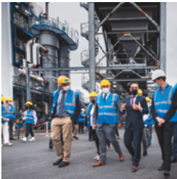
Visite d'une usine avec un ministre en déplacement dans la circonscription

Être Député, c'est, vous le savez, effectuer un travail de terrain et de proximité