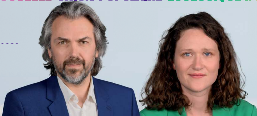
Aymeric CARON candidat