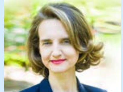
Céline Calvez — 42 ans Votre Députée depuis 2017

10 Pour une France forte dans une Europe indépendante Avec l'Europe de la défense qui protège, l'Europe des frontières qui lutte contre l'immigration clandestine et l'Europe technologique qui lutte contre la domination des grandes plateformes.