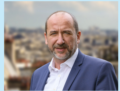
Dominique Da Silva — 53 ans Député, ancien entrepreneur Né à l'Isle-Adam, installé à Moisselles depuis 1995, il est père de deux filles. Élu député de la 7 e circonscription du Val d'Oise en 2017, il fut 1 er maire adjoint de Moisselles, délégué aux Finances de 2008 à 2017 et conseiller municipal jusqu'en 2020.

10 Pour une France forte dans une Europe indépendante Avec l'Europe de la défense qui protège, l'Europe des frontières qui lutte contre l'immigration clandestine et l'Europe technologique qui lutte contre la domination des grandes plateformes.