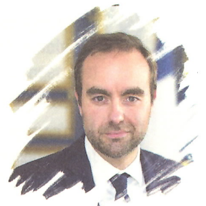
Sébastien LECORNU Ministre des Armées Ancien Ministre des Outre-mer