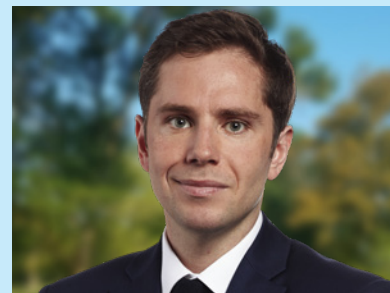
Pierre-Alexandre Anglade Député

Une armée plus puissante, lutte ciblée contre la cybercriminalité, création de 200 brigades de gendarmerie dans les zones rurales et villes moyennes, renforcement des forces de l'ordre sur le terrain.