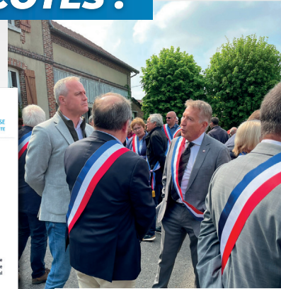
Opposition ferme contre les éoliennes avec les élus locaux