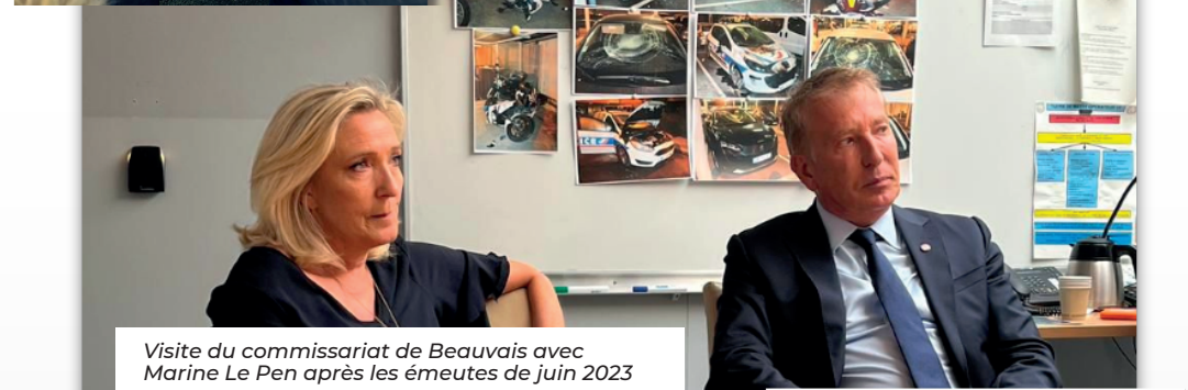
Visite du commissariat de Beauvais avec Marine Le Pen après les émeutes de juin 2023