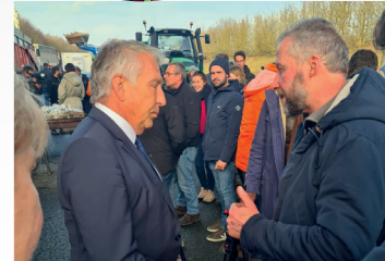
Total soutien à la contestation légitime de nos agriculteurs