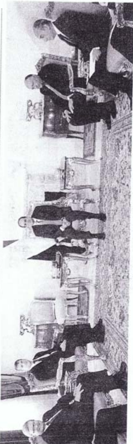
الرئيس السيسي خلال استقباله وفدا من البرلمان الفرنسي

كتب - أحمد سامي مطولي: شهد الرئيس عبدالفتاح السيسي على سفيرة فرنسا السيدة الفرنسية، الكنتيل ماريشات خولم غارنو، مساء الثلاثاء الموافق ١١ من أيار الجاري، في مقر الرئاسة بـ القاهرة، بحضور عدد من كبار القادة بوزارة الخارجية الفرنسية، كما حضرها عدد من كبار القادة بوزارة الخارجية المصرية، في استقبالهم.